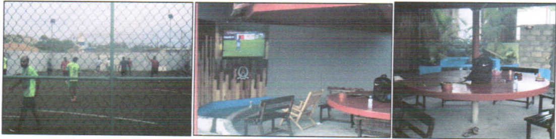
19.1.16 دؤورج قورئى ئىلاھىيەت ئىنىستىتوتى ئىلاھىيەت ئىنىستىتوتى