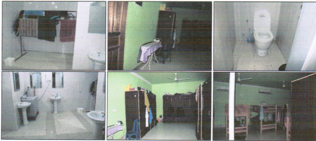
19.1.15 دؤورج قورئى ئىلاھىيەت ئىنىستىتوتى بىر ئىلاھىيەت ئىنىستىتوتى