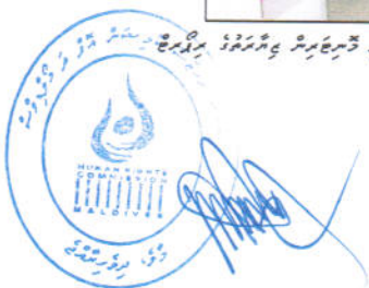
ئىلاھىيەت ئىنىستىتوتى / ئىلاھىيەت ئىنىستىتوتى دۆلەت ئىنىستىتوتى