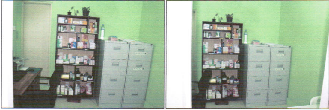
19.1.14 دؤورج قورئى ئىلاھىيەت ئىنىستىتوتى