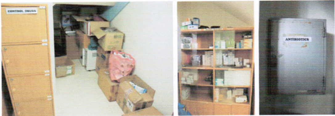
صُوْرَةُ 1: عَمَلِيَّاتُ تَحْقِيقِ الْمَخْلُوْعَاتِ