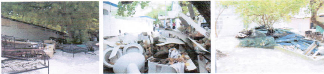
صُوْرَةُ 2: تَحْقِيقُ الْمَخْلُوْعَاتِ فِي الْمَخْلُوْعَاتِ