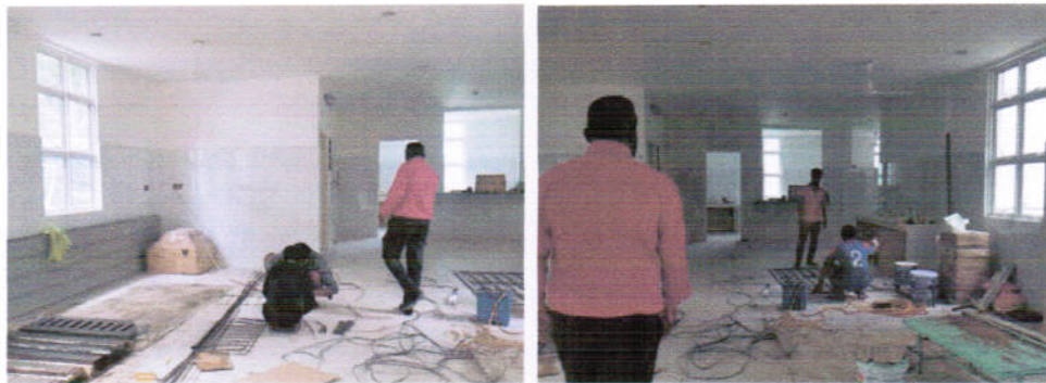
صُوْرَةُ 3: عَمَلِيَّاتُ تَحْقِيقِ الْمَخْلُوْعَاتِ فِي الْمَخْلُوْعَاتِ