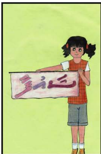
انور شہیرہ ڈراما 19 درجنس فونڈ ٹروسٹ