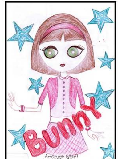
انور شہیرہ ڈراما 16 درجنس فونڈ ٹروسٹ