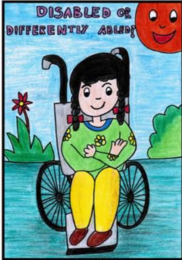
سہیلہ بیگم ڈراما 13 درجنس فونڈ ٹروسٹ