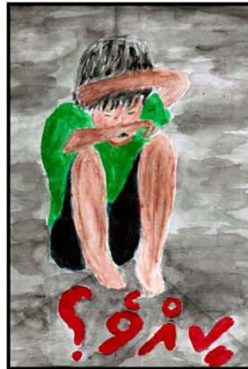
انور شہیرہ ڈراما 16 درجنس فونڈ ٹروسٹ