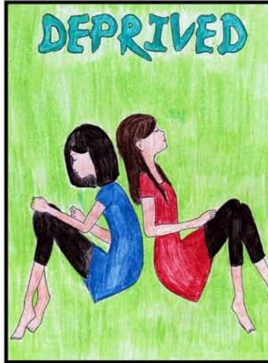
سہارہ انور ڈراما 13 درجنس فونڈ ٹروسٹ