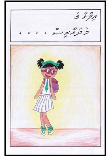
ذہیرہ ارجحہ ڈراما 13 درجنس فونڈ ٹروسٹ